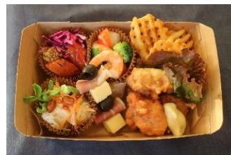
特製おつまみセット（イメージ）