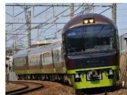
リゾートやまどり外観（イメージ）