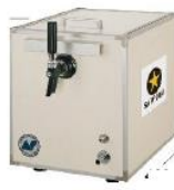
ビールサーバー （イメージ）