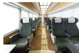
リゾートやまどり車内（イメージ）