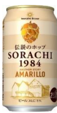
SORACHI1984 ANOTEHR STORY AMARILLO