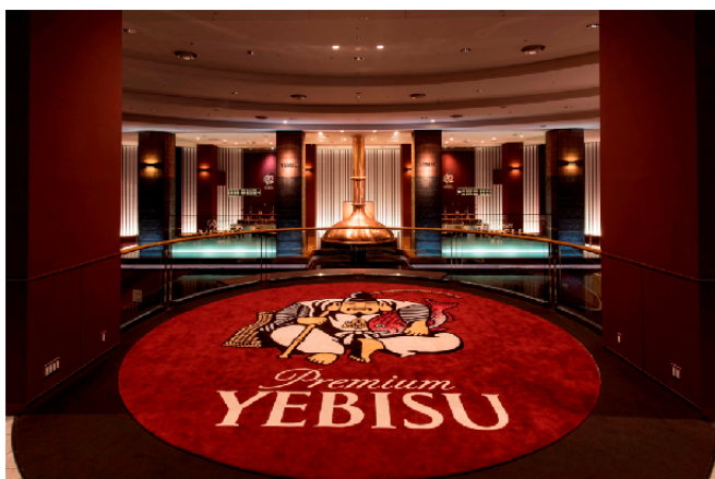
エビスビール記念館