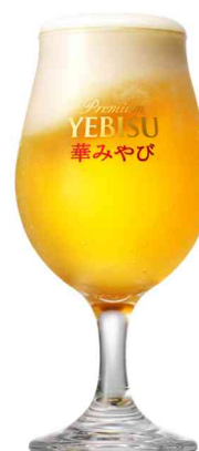
エビス 華みやびオリジナルグラス