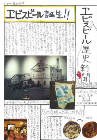
エビスビール新聞の完成イメージ