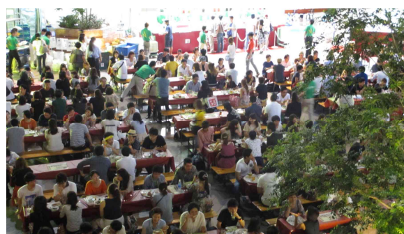
写真は昨年の様子です