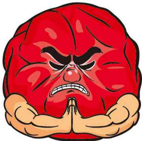
キャラクター「男梅蔵」

「未だかつてない梅本来のおいしさを味わえるキャンデーを作りたい！！」その思いから生まれた「男梅」キャンデーは、今までにない梅そのものが持つ味わいを追求した本格的な梅キャンデーです。塩味と旨味が凝縮された濃厚な味わいが楽しめる様、梅果汁をたっぷり使い、じゅわっと広がる深い味わいを作り出しました。この味わいを「男梅」と言うネーミングにより、素材自体が持つ力強さと、芯がブレない味を感じていただけるように表現しました。2007年の発売以来、今までにない味わいを愛してやまないファンの方々に支えられ、スティックタイプののど飴や、タブレット、グミ、干し梅の素材菓子など、幅広くブランドでの展開を行っています。CMはこの味を「男梅蔵」というキャラクターに例え、自信の味を極めるため、修行に邁進するというコンセプトで、親しまれています。現在ではノーベル製菓を代表する人気商品です。