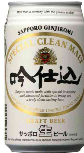
サッポロ 吟仕込み