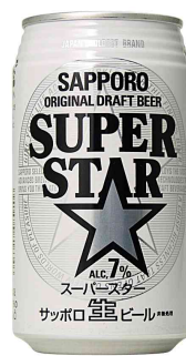
サッポロ スーパースター