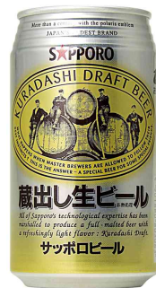
サッポロ 蔵出し生ビール