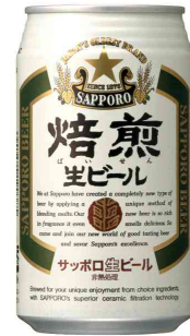
サッポロ 焙煎生ビール