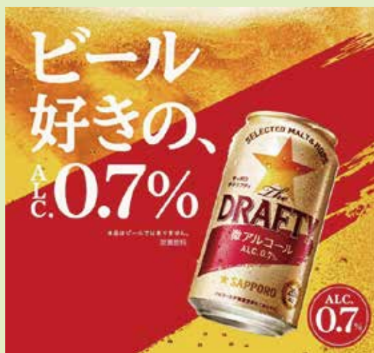
アルコール0.7% サッポロドラフティ

健康志向を背景として広がってきた為、日本でも同様のトレンドが起こっており、外食でもノンアルコール・低アルコールの専門店の開業が増えています。ニーズを考えるポイントは「あえて飲まない」という点であり、ただのソフトドリンクではなく嗜好品としての価値を高める工夫が必要です。