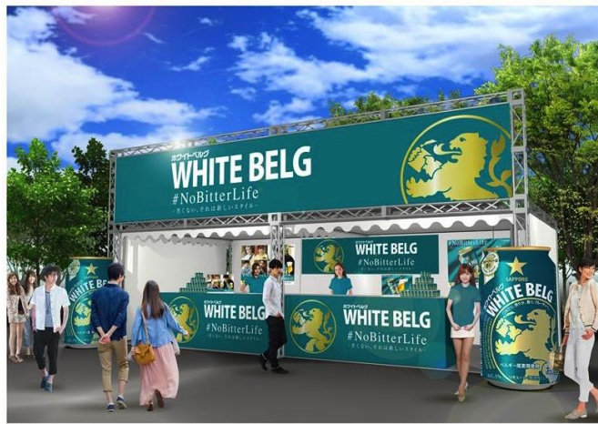
東京会場（OCEAN PEOPLES ブース出展）イメージ図

2017年7月8日（土）・9日（日）：代々木公園 ※ビーチフェスティバル「OCEAN PEOPLES」にブース出展 7月17日（月・祝）：名古屋テレビ塔、8月10日（木）：神戸ポートタワー