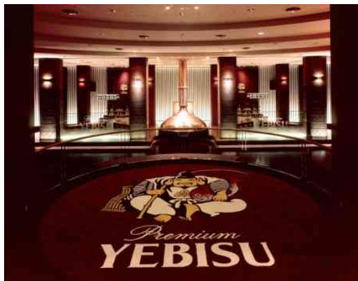
アビスビール記念館