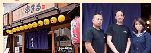
「西日暮里酒場 串まる」の皆さん