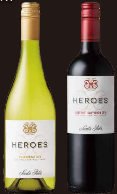
(左)シャルドネ (右)カベルネ・ソーヴィニヨン 750ml ¥828(参考小売価格)